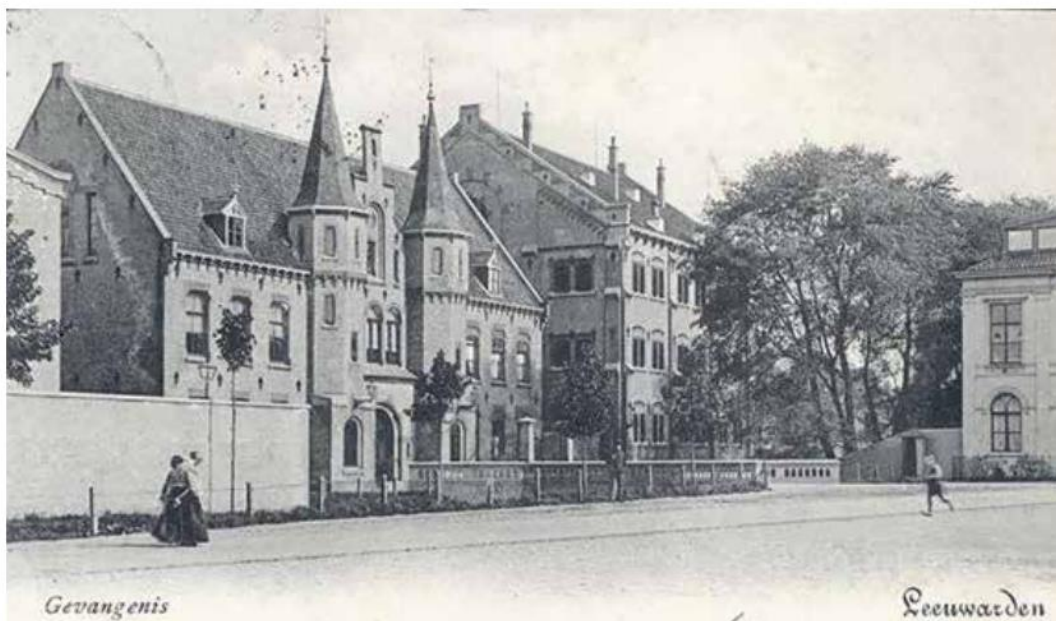
Strafgevangenis te Leeuwarden rond 1904.