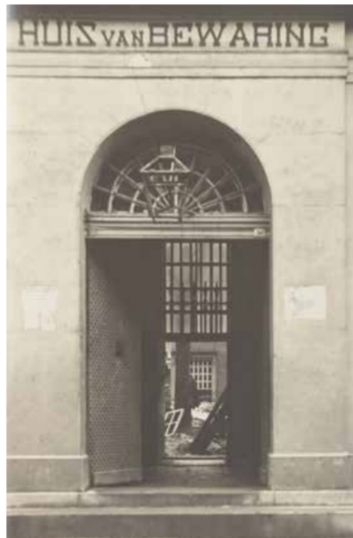
Huis van Bewaring te Arnhem poort. Huis van Bewaring Beekstraat