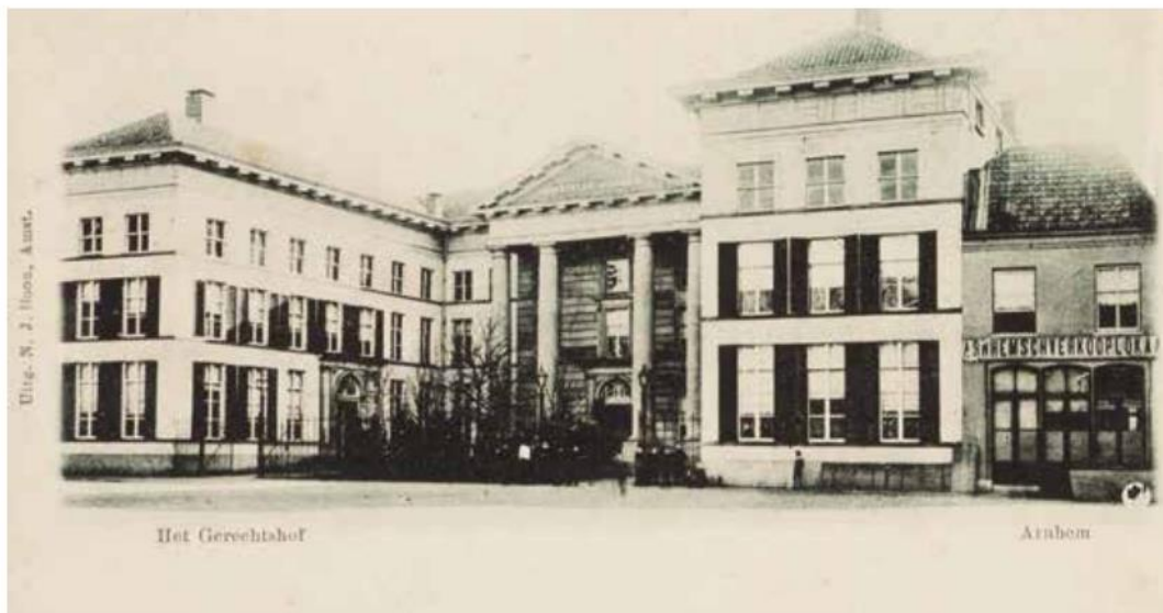
Gerechtshof te Arnhem.